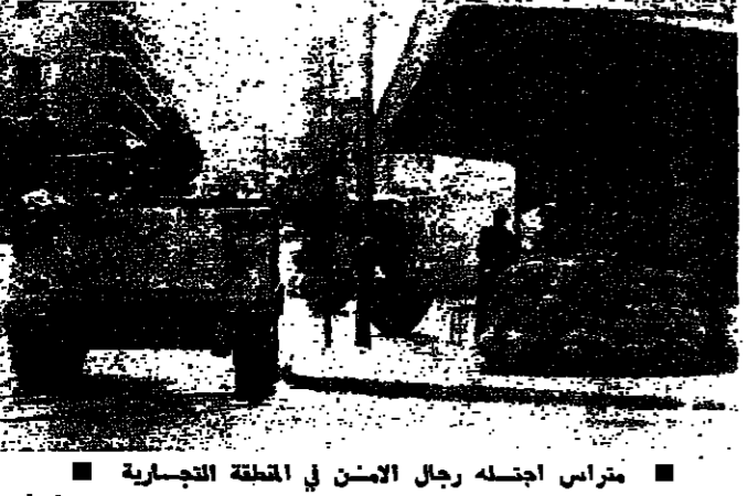
متراس اجنله رجال التن في المنطقة التجارية